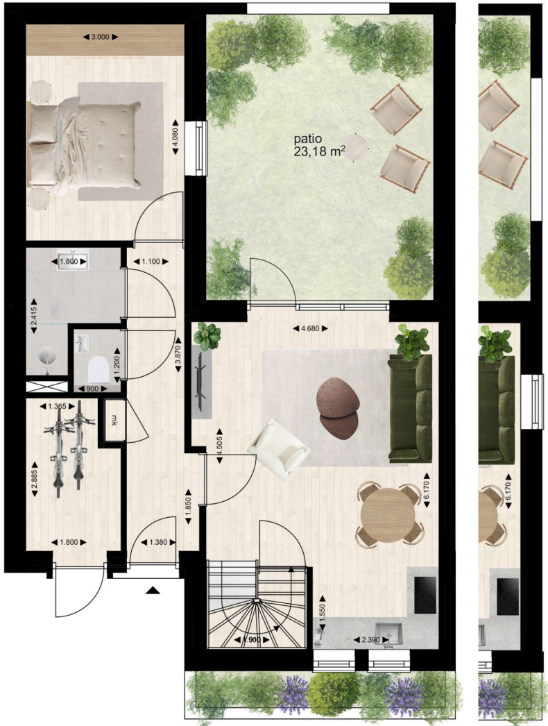
kavel 7 t/m 12